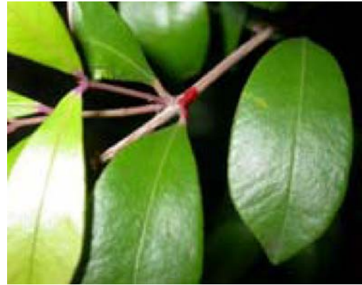
Foto 2. Mærk bladene med tuschpen lige nedenfor bladpladen.