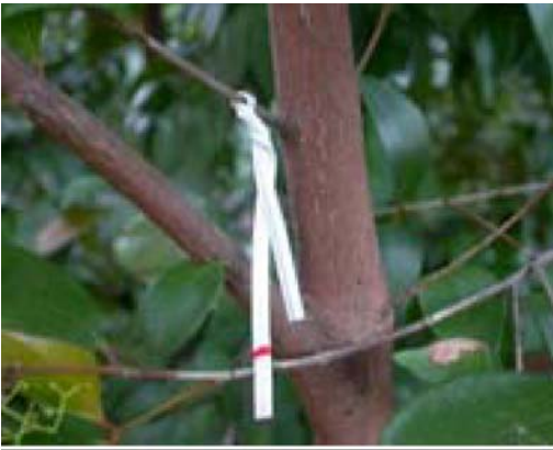
Foto 1. Mærk hver gren med en enkelt markeret "poselukker". Sørg for at markeringen er langt nok væk fra de markerede blade til ikke at beskadige dem i vinden.